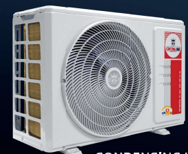
CONDENSING UNIT MODEL :: CCS-MFE