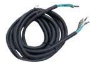
สายไฟขนาดยาว 4.3 เมตร