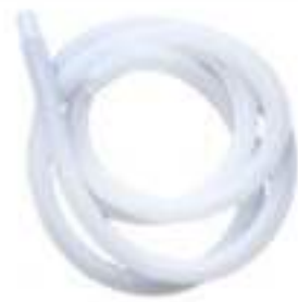
ท่อน้ำทิ้ง