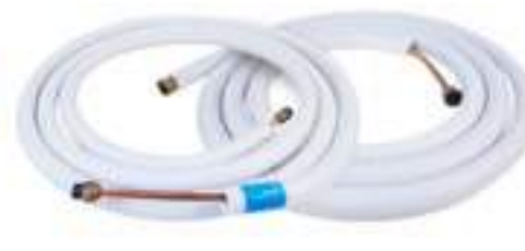
ท่อทองแดง