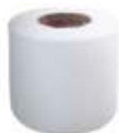
เทปพันสายไฟ